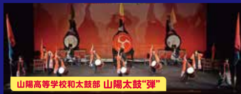
山陽高等学校和太鼓部 山陽太鼓“弾”